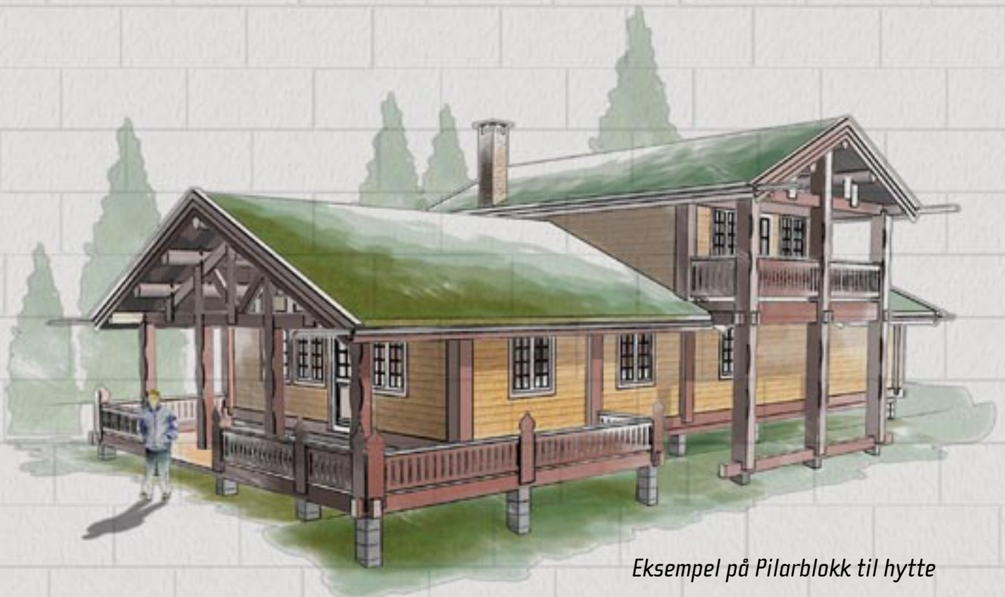
Eksempel på Pilarblokk til hytte