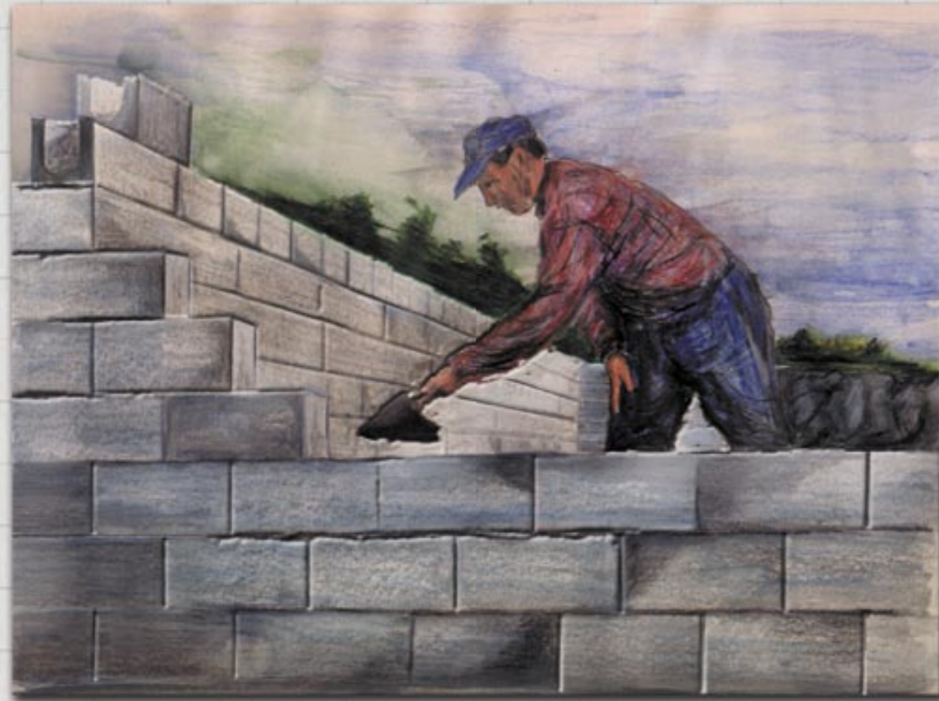
Nøyaktighet i hjørne og korrekt rettesnor, gir effektiv muring og et pent murverk