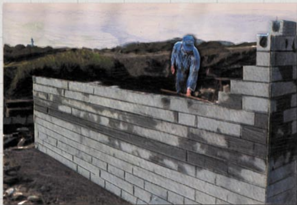
Armering legges ut før neste skift

Øverste skift armeres på samme måte som over vinduer, det vil si ved hjelp av U-blokker. Alternativt kan en slå opp treforskaling og støpe en armert krone (2x8 millimeter kamstål). Forankring til byggets rammeverk støpes fast i muren.